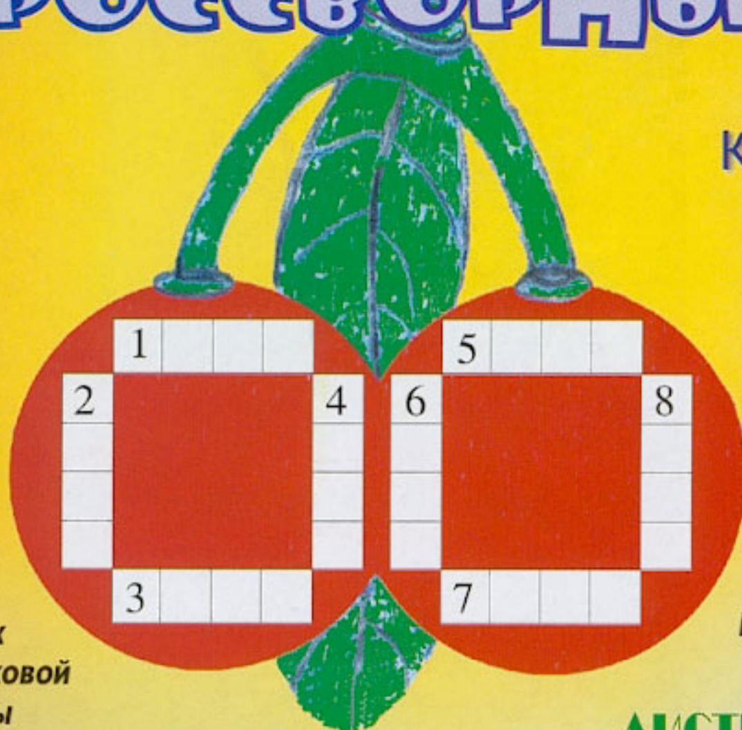
Рисунок Шорниковой Альбины